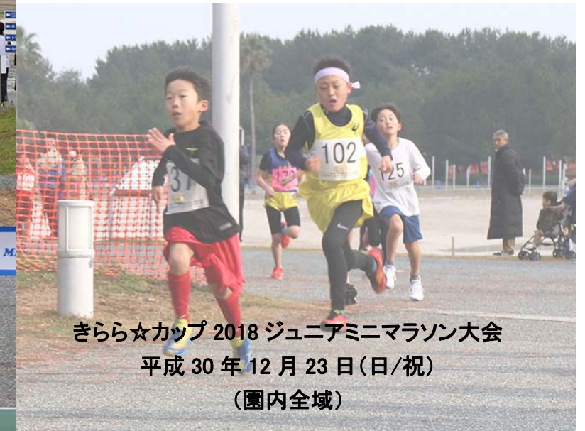
きらら☆カップ 2018 ジュニアミニマラソン大会 平成 30 年 12 月 23 日(日/祝) (園内全域)